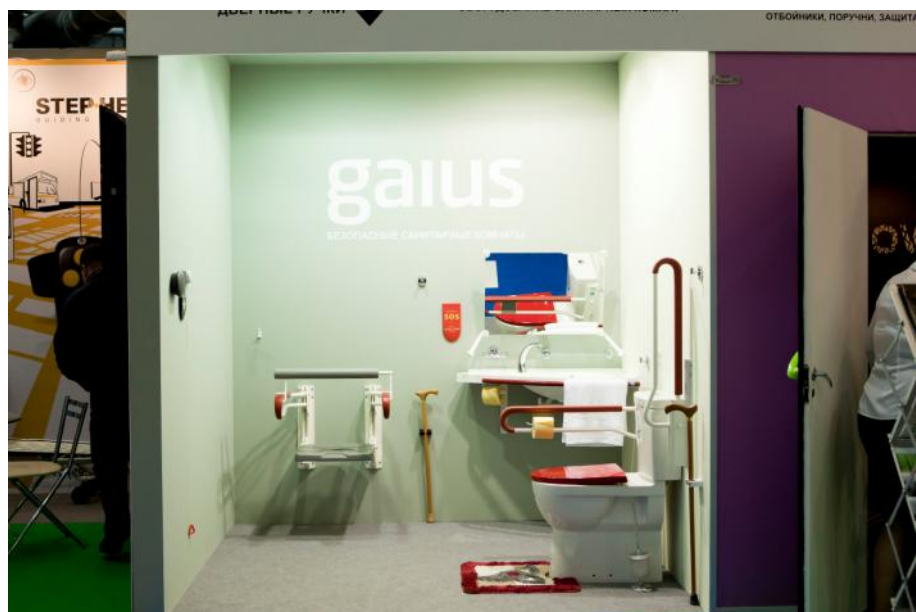
Оборудование для туалетной комнаты компании Gaius (Финляндия)