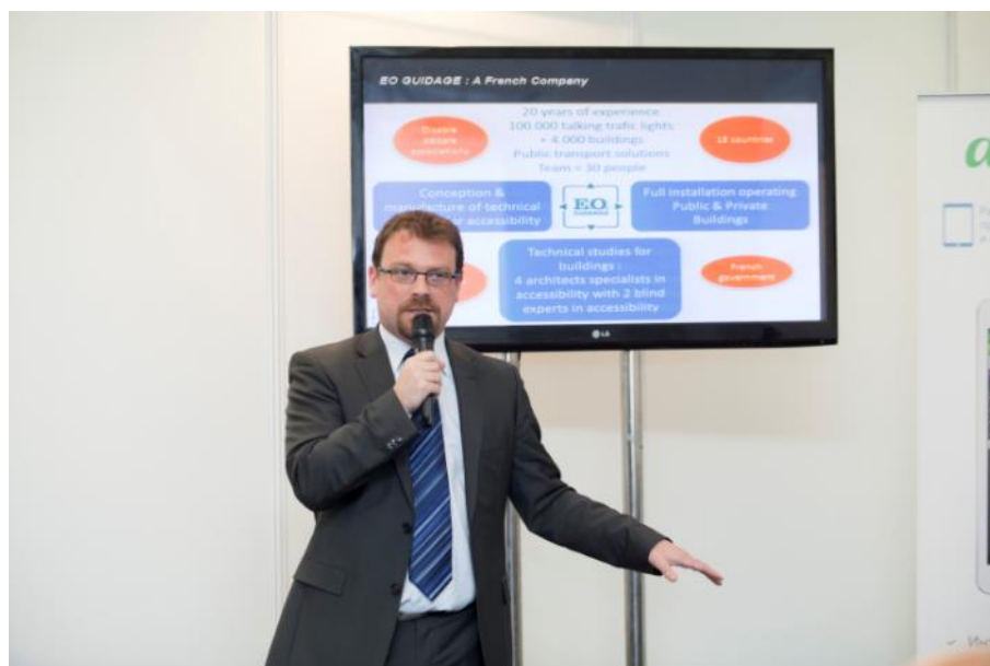
Выступление Управляющего директора компании E.O. GUIDAGE (Франция)