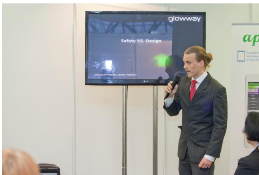
Выступление представителя компании GLOWWAY Oy (Финляндия)