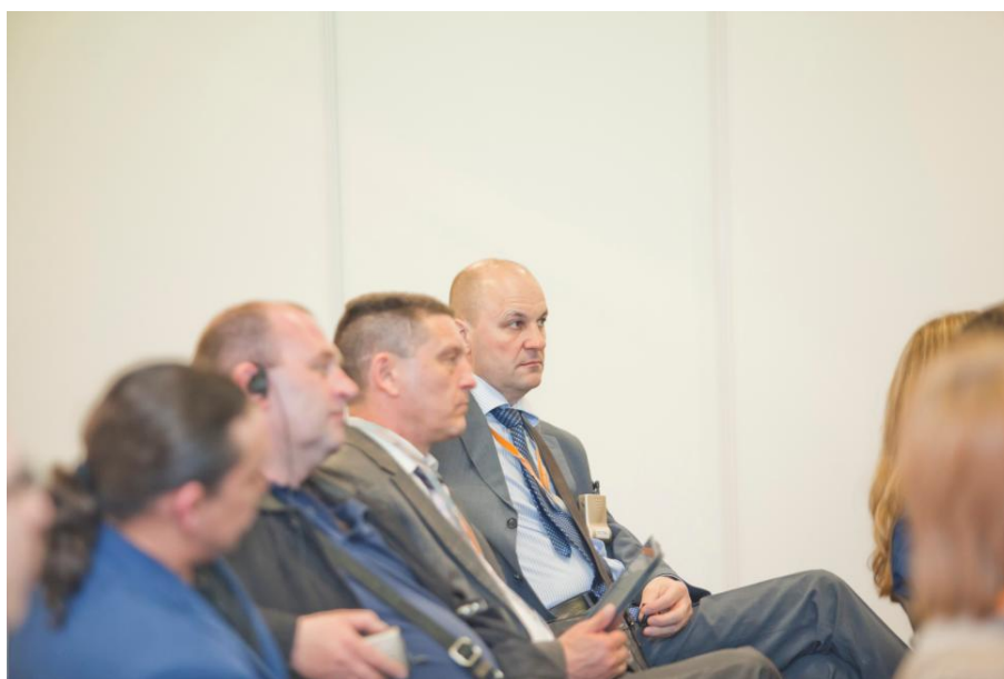
Участники конференции «Вектор движения».