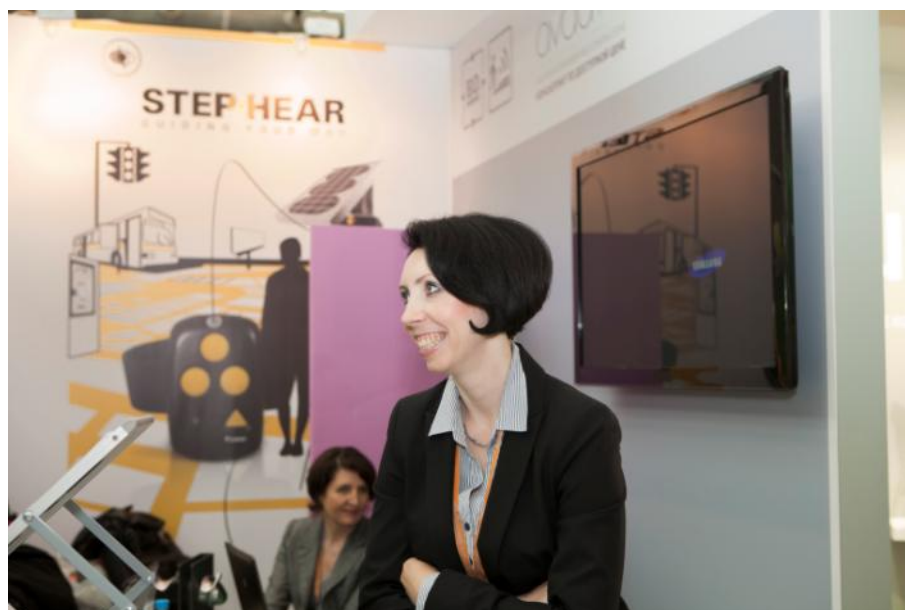
Представитель компании STEP-HEAR Ltd на выставке.