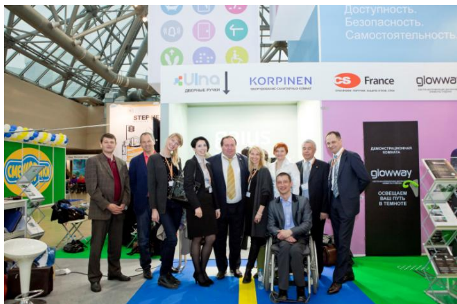
После подведения итогов конференции.