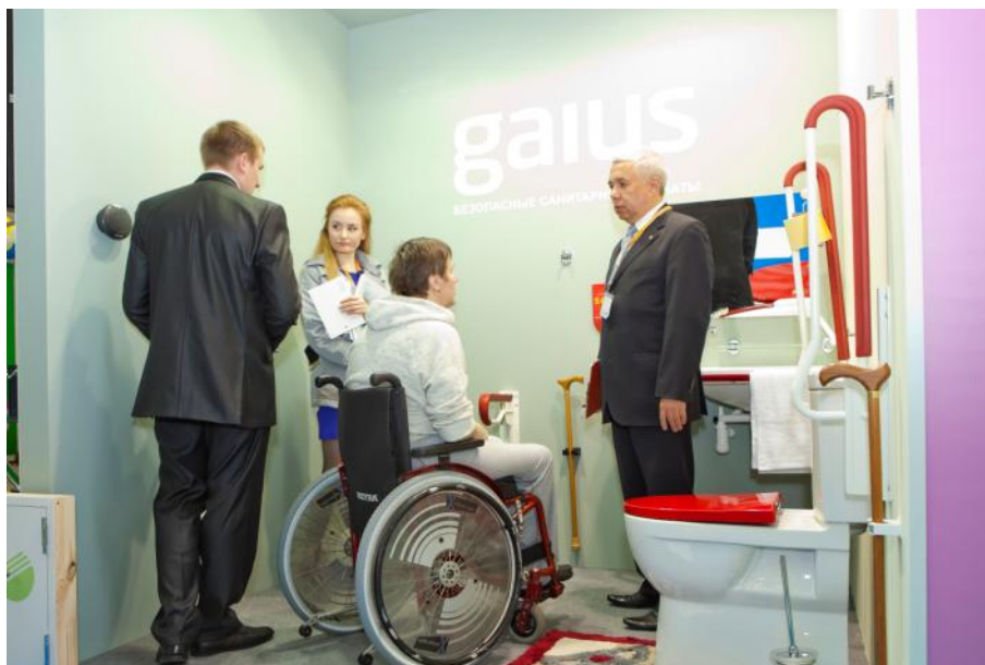
Работа на стенде с посетителями выставки.