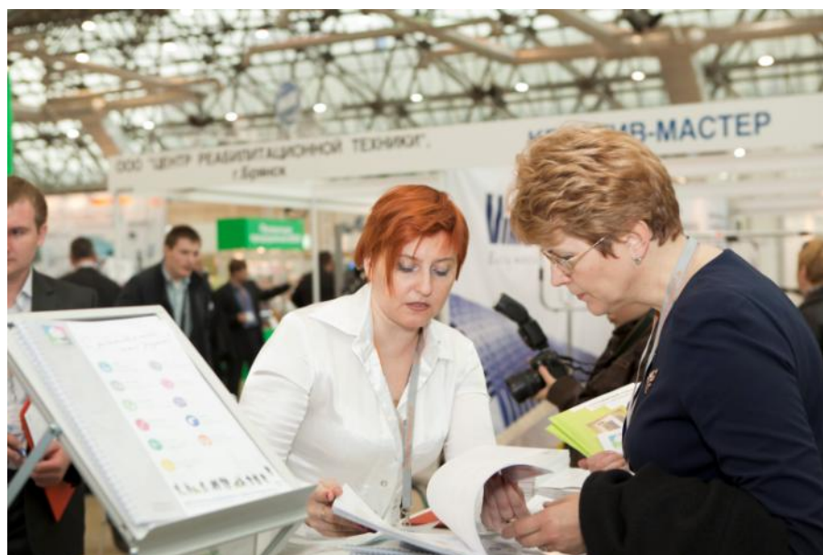
Активное общение с посетителями выставки на стенде.