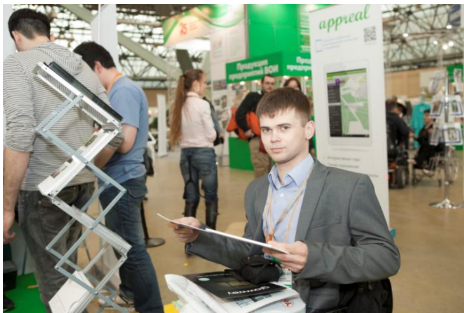
Наши гости на стенде.